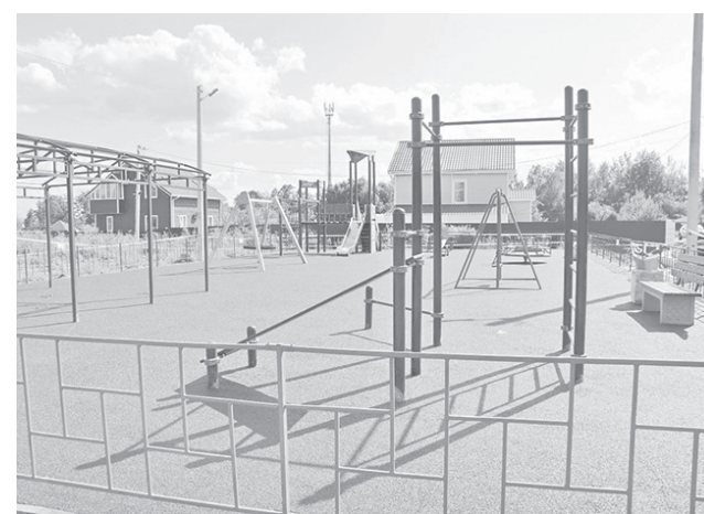
Современная площадка в деревне Чурилково

Каждый проект предварительно прошел общественное обсуждение. Решение о том, какую территорию благоустроить и как она должна выглядеть, какие функциональные зоны на ней создавать, принимали сами жители.