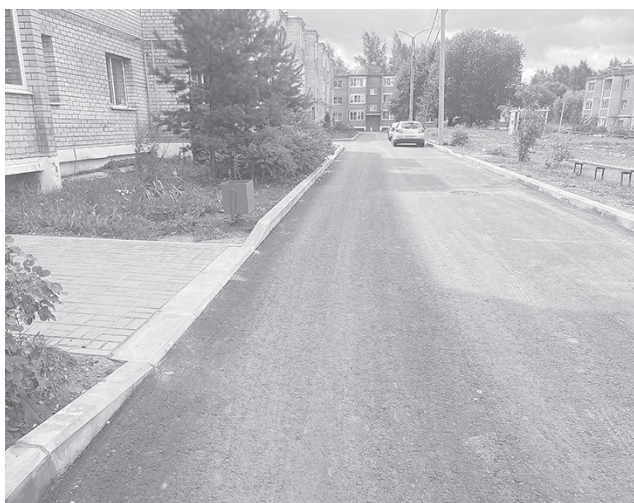
Двор в поселке Щедрино после ремонта