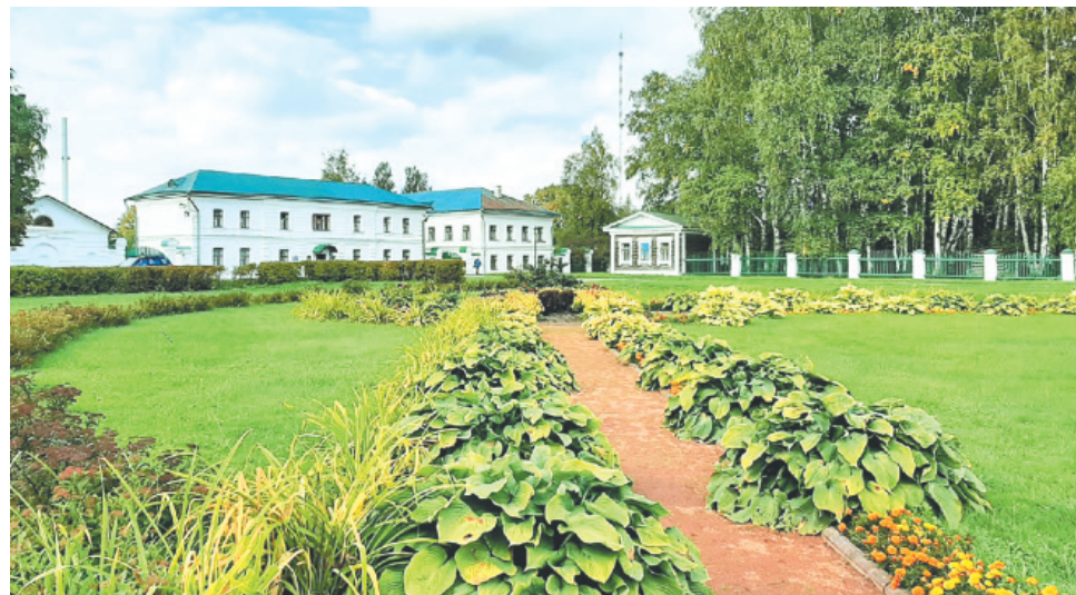
Музей-заповедник Н.А. Некрасова «Карабиха»