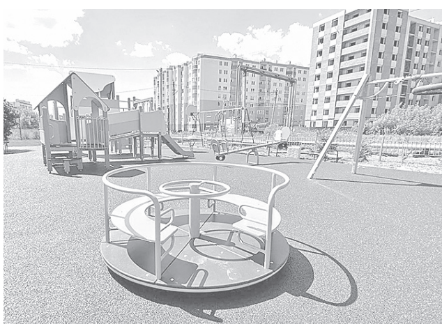
Новая площадка в поселке Красный Бор