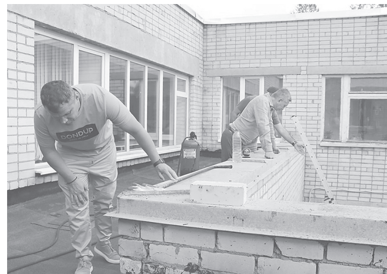
Ремонт кровли школы в поселке Ярославка завершен

Глава района оценил качество работ по ремонту кровли, установке системы пожарной сигнализации, системы оповещения и управления эвакуацией. Они выполнены на высоком уровне, персонал на отлично знает алгоритм действий при возникновении ЧС.