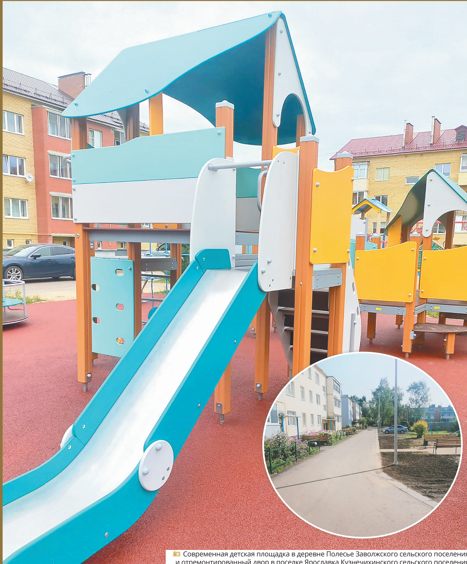
Современная детская площадка в деревне Полесье Заволжского сельского поселения и отремонтированный двор в поселке Ярославка Кузничихинского сельского поселения