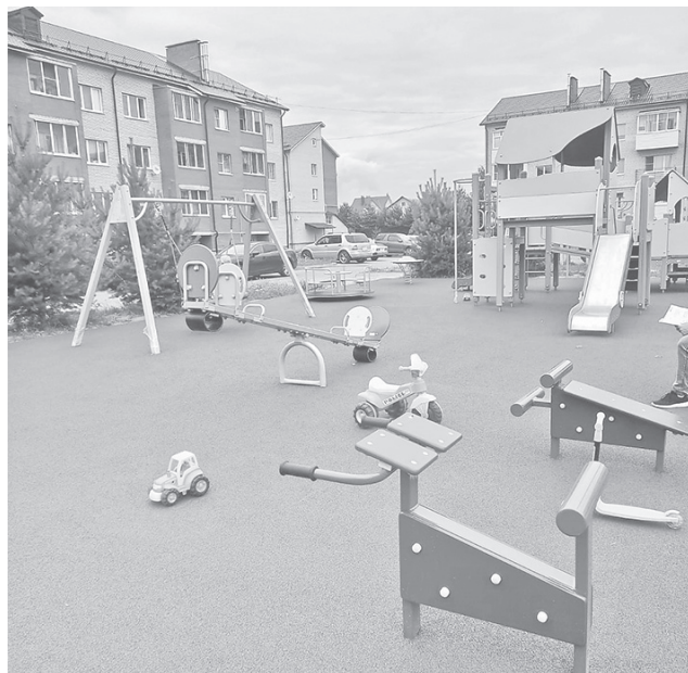
Детская площадка в деревне Полесье

планировано благоустройство пяти общественных территорий. В их числе детско-спортивная площадка в поселке Заволжье, Экопарк рядом с ЖК «Экогород» в поселке Красный Бор, детская площадка с резиновым покрытием в деревне Чурилково Ивняковского сельского поселения, футбольное поле в парке «Солнечный» Туношенского сельского поселения и общественная территория на улице Олимпийской в деревне Глебовское Кузнецихинского сельского поселения.