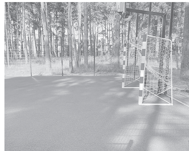
Спортивная площадка в Экопарке

По направлению «Формирование комфортной городской среды» губернаторского проекта «Решаем вместе!» в нашем районе на это лето за-