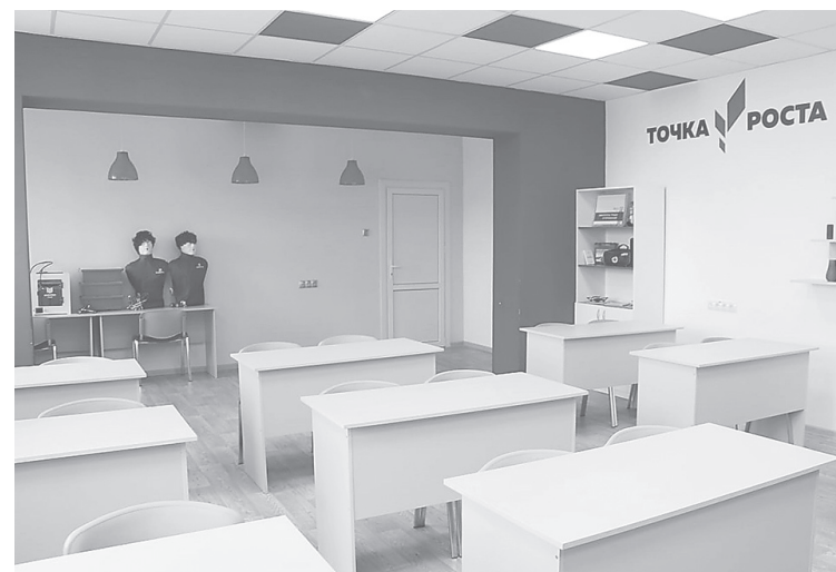
В центре «Точка роста»